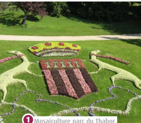
1 Mosaïculture parc du Thabor