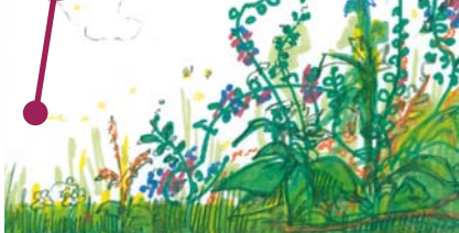
Jardins de nature