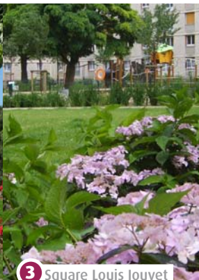
3 Square Louis Jouvet