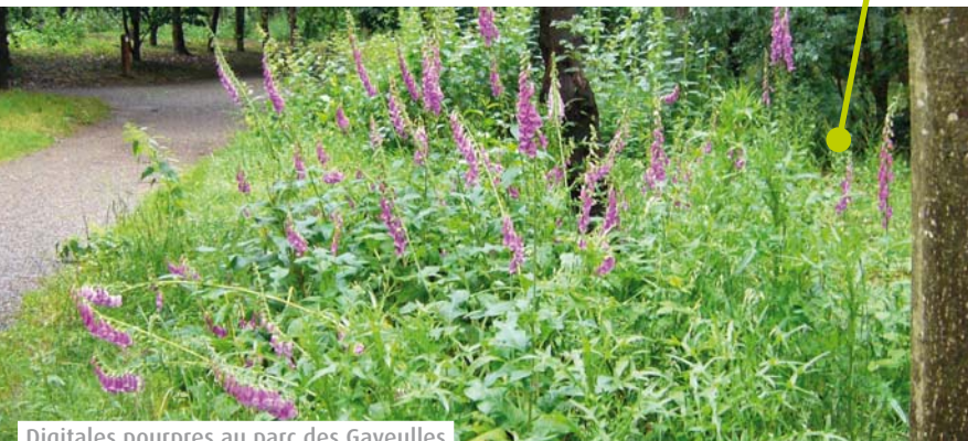
Digitales pourpres au parc des Gayeulles

Ce logo labellise les pratiques de gestion différenciée des espaces verts.