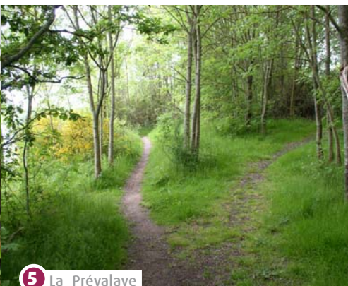
5 La Prévalaye