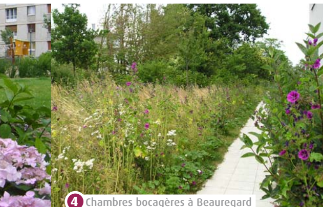
4 Chambres bocagères à Beaugard