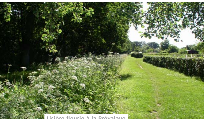
Lisière fleurie à la Prévalaye

Depuis les années 70, la Ville de Rennes préserve les haies bocagères, patrimoines des paysages d'Ille-et-Vilaine. Complétées par de jeunes arbres et arbustes, ces haies, mélanges de différentes essences, constituent de véritables écosystèmes qui accueillent la flore et la faune.