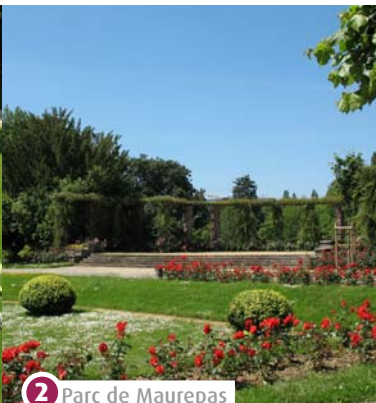
2 Parc de Maurepas