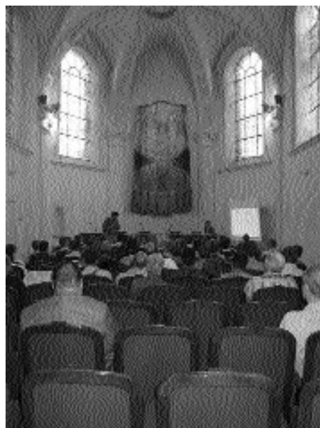
Chapelle de la Maison des Associations - Douai

Les retours de cette journée se sont révélés très positifs et montrent l'intérêt que portent les communes à un fleurissement plus naturel.