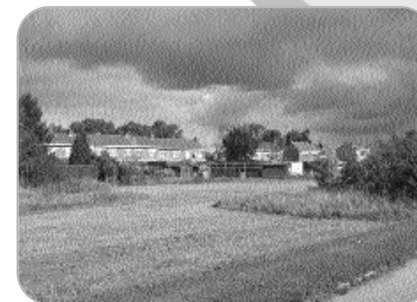
Quesnoy sur Deûle

La journée s'est achevée à Deûlemont sur l'étang de Tournecul. Cette zone humide, connaît de grands aménagements dont les objectifs sont de favoriser biodiversité et accueil du public.