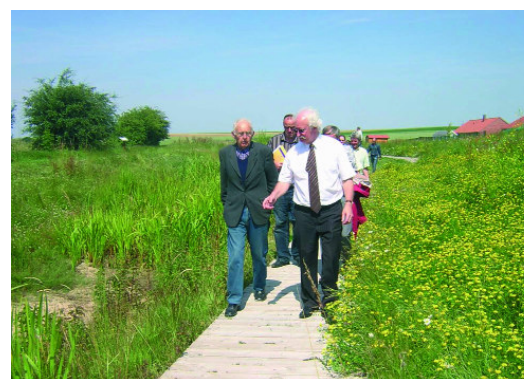
Visite de Croisilles avec le Pays d'Artois

Dernièrement, la CAHC (Communauté d'Agglomération d'Hénin-Carvin) a proposé un forum d'informations et d'échanges sur le thème de la gestion différenciée et le Pays d'Artois (association regroupant 255 communes !) organise des journées de découverte de la gestion différenciée. Une exposition est également à disposition des communes artoises pour sensibiliser usagers, techniciens et élus.