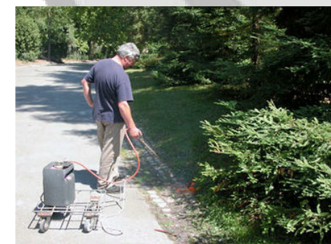
Désherbage thermique à Bordeaux

La ville de Bordeaux s'est lancée aussi autour d'un site pilote, le Parc bordelais. Toutes les actions de gestion différenciée s'y retrouvent : tonte différenciée, paillage, recyclage des déchets verts, plantes couvre-sols, abri pour animaux, réduction des phytosanitaires et de la consommation d'eau. N'hésitez pas à visiter le site internet de la ville, riche en informations !