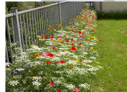
Fleurissement des clôtures à Brebières

plantes sans chauffage et de mettre ses agents sur des vélos !