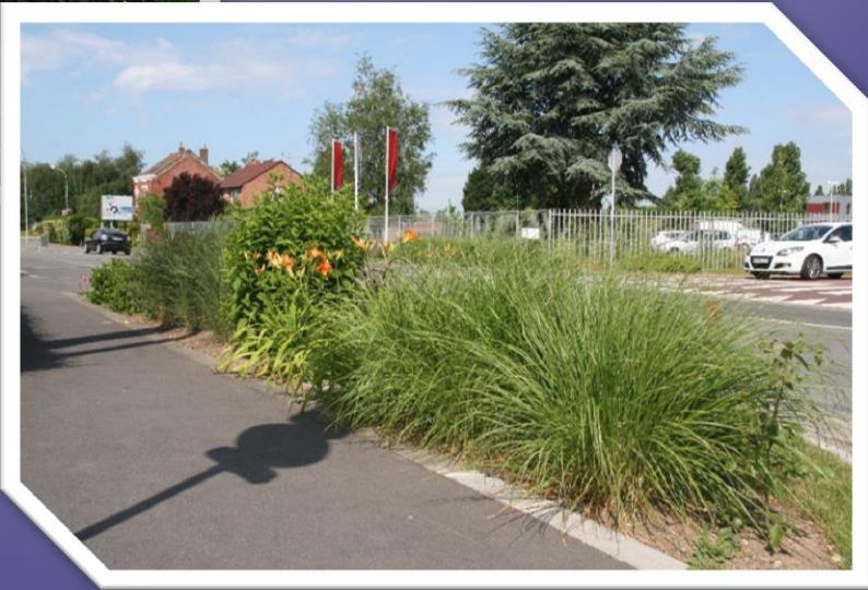
Incorporation de plantes vivaces