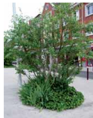
Lierre et iris en pied d'arbuste

Produisez vous-même vos plantes couvre-sol : comme toutes les vivaces, les plantes couvre-sol peuvent être divisées pour alimenter de nouveaux massifs.