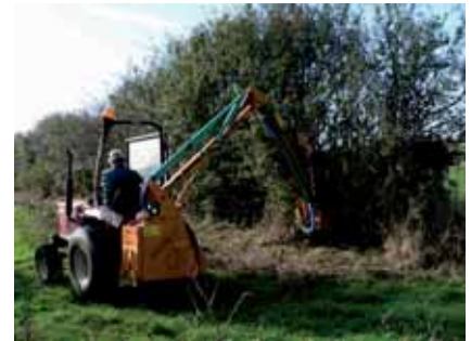
Taille mécanisée au lamier