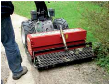
Rabo (+ porte-outil) sur allée sablée