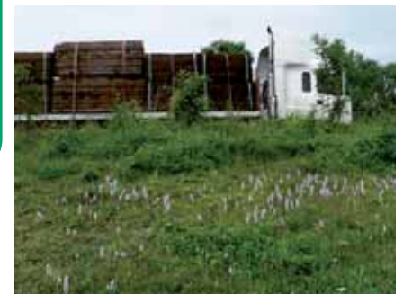
Orchidées et camions font bon ménage