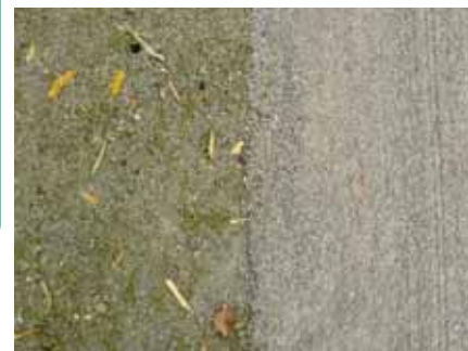
AVANT - APRÈS Désherbage mécanique de stabilisé