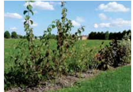
Paillage au pied d'une jeune haie

Lorsque la haie commence à être bien fournie, préserver le long de celle-ci un ourlet herbeux qui la protégera et favorisera la biodiversité.