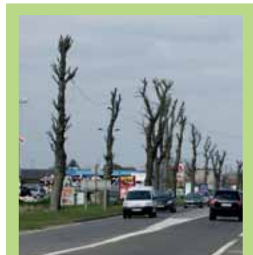
NON aux tailles drastiques, aussi néfastes pour la santé des arbres que pour le paysage !