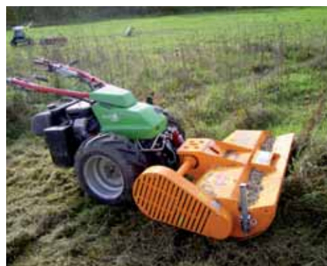
Porte-outil et plateau de fauche