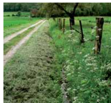
Bas-côté fauché = flore préservée

Lorsque son application est possible, on la réservera aux talus présentant un rôle écologique notable. On veillera dans ce cas à appliquer une fauche tardive, et à exporter la matière végétale coupée (= le foin). Le foin issu des travaux de fauche en bordure de route ne peut être utilisé pour le fourrage que si la route est peu passante.