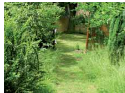
Les herbes hautes : un refuge naturel

Les insectes parasitoïdes pondent leurs œufs dans le corps d'autres insectes ( larves ou adultes ). Ces espèces contribuent notablement à la régulation des ravageurs de culture.