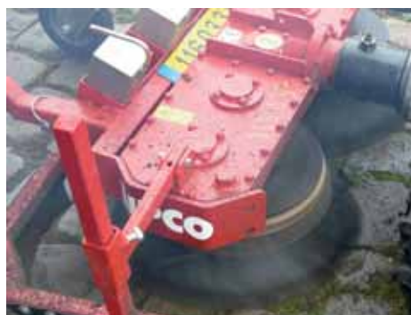
Brosses (+ tracteur) sur pavés