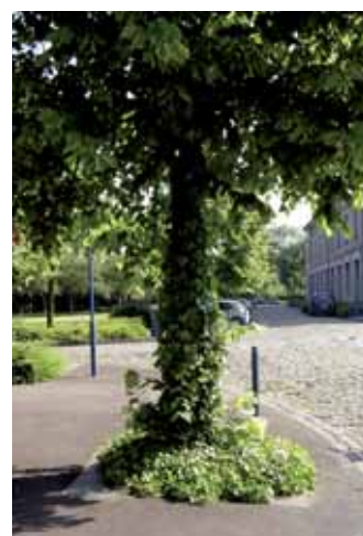
Végétaliser les pieds d'arbres