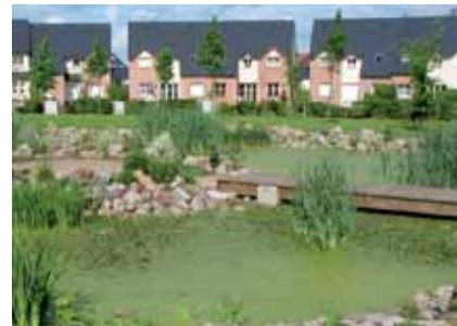
Bassin en coeur de lotissement