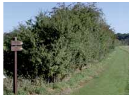
Haie champêtre en bordure de sentier