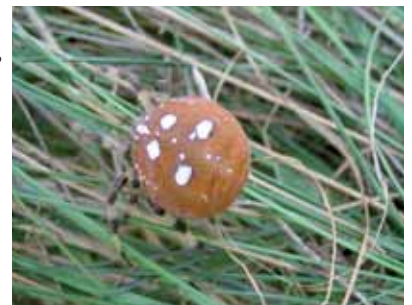
Epeire à 4 points

- Mélange pour gazon fleuri : ils sont composés de graminées et de fleurs supportant une tonte assez régulière ( Bellis perennis, Prunella vulgaris... ).