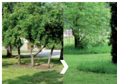
Laisser pousser plutôt que désherber

Le désherbage des pieds d'arbres est rarement indispensable. Le recours au mulch, aux plantes couvre-sol ou à des plantations ( vivaces à fleurs ou graminées ) permet d'éviter l'usage de produits phytosanitaires et préserve les jeunes plants des coups de lames et autres blessures.