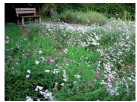
Prairie fleurie "sauvage"

■ Exemple de mélange d'annuelles, bisannuelles et vivaces sans graminées : Achillea millefolium, Centaurea thuyllieri, Dipsacus fullonum, Echium vulgare, Leucanthemum vulgare, Malva moschata, Origanum vulgare, Centaurea cyanus, Trifolium pra-tense, Leontodon hispidus et Daucus carota.