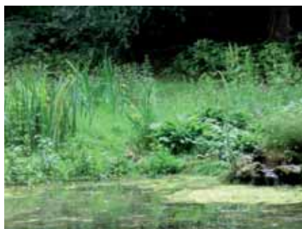
La mare, un milieu de vie rare et précieux

NB : un simple tas de pierres, un empilement de briques dans un coin abandonné, une légère dépression du sol, un bassin végétalisé sont autant de solutions alternatives.