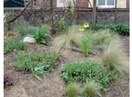
Paillage de massif (lin)