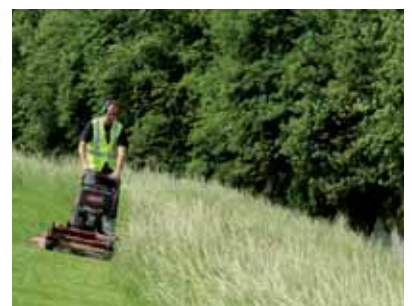
Tonte en bordure de prairie