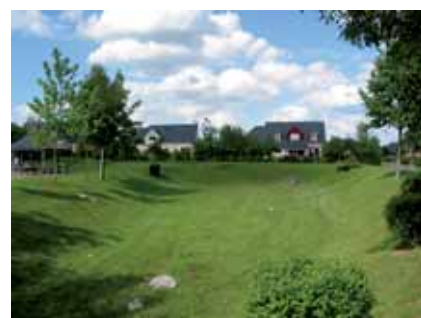
Grand bassin d'infiltration