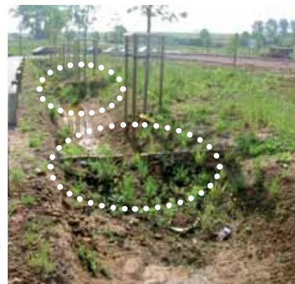
Fossé avec redents