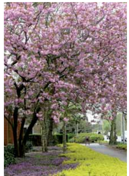
Arbres et couvre-sol fleuris