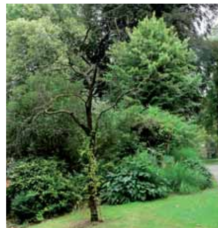
Selon le contexte, garder les arbres morts