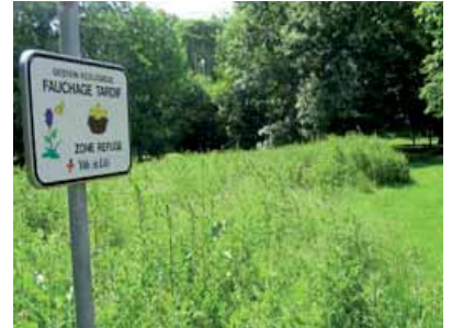
Zone de fauche avec signalétique