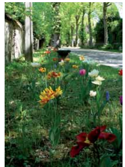
Bulbes en entrée de village

* Adventice : Ce terme désigne une plante herbacée ou ligneuse non souhaitée à l'endroit où elle se trouve. (source : wikipédia).