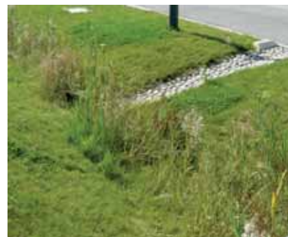
Noue drainante en bord de voirie