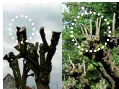
Mauvaises tailles en tête de chat