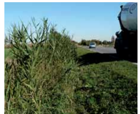
Préservation du fossé