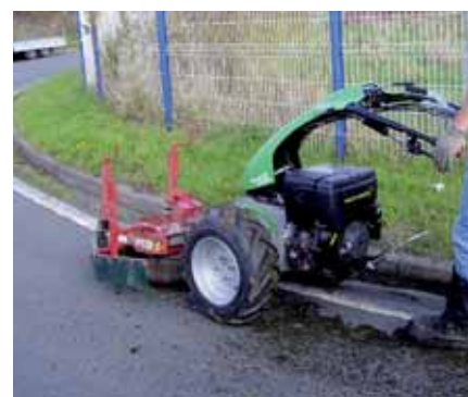
Brosses (+ porte-outil) sur fil d'eau.