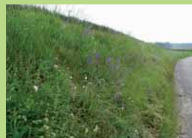
Talus large et en déblais + végétation variée = intérêt marqué