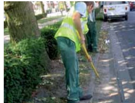
Désherbage à la binette