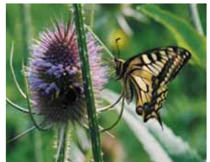
Fleur sauvage, gîte et couvert