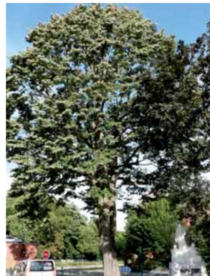
Une taille douce pour un port harmonieux