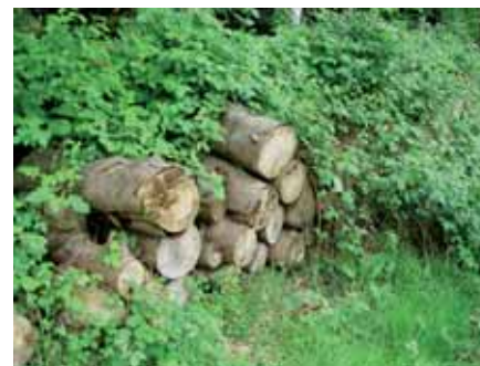
Un tas de bois pour accueillir la faune

Dans un espace vert, on favorise le retour à un équilibre écologique en ménageant une place pour la faune et la flore sauvage. Pour cela, il faut multiplier les milieux de vie et les micro-habitats.