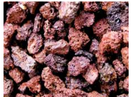
Détail de pouzzolane