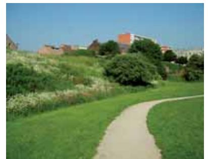
Paysage varié par une tonte différenciée

(* ) Le pâturage peut-être une solution intéressante mais elle ne sera pas développée ici.