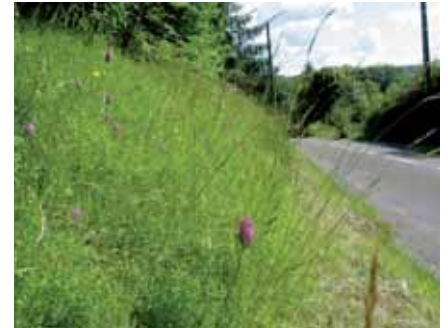
Bande de sécurité et talus fauché