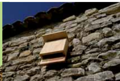
Gîtes à chauves-souris

Une colonie d'environ 50 chauves-souris peut, selon les espèces, consommer jusqu'à une tonne d'insectes en l'espace d'un été !