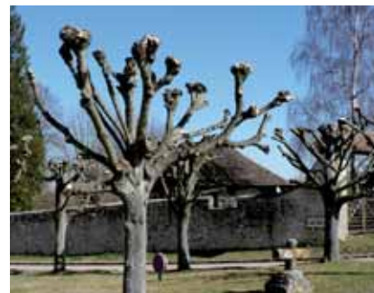
Bonne taille en tête de chat