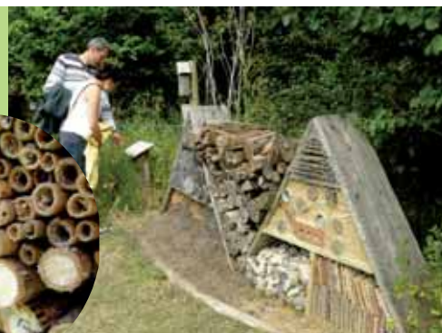
L'hôtel à insectes : à la fois refuge et outil de sensibilisation