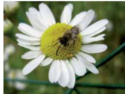
Qui dit fleur, dit insectes !