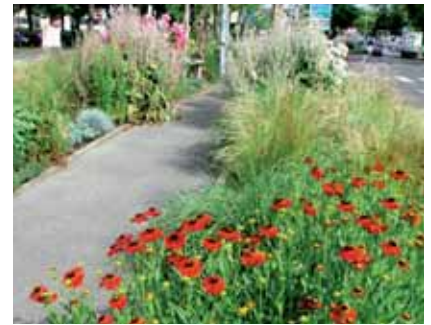
Massifs de vivaces

Faucher les bulbes lorsque les fleurs sont fanées et les feuilles bien sèches (environ un mois après la dernière floraison).