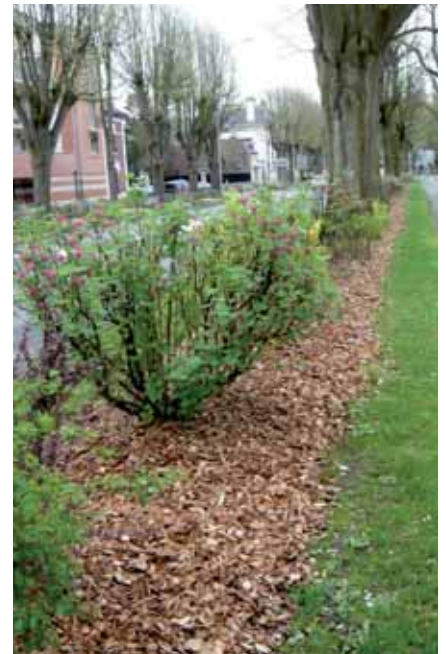
Paillage en pied de haie (broyat)

Vérifier au moins une fois an par l'épaisseur des paillages végétaux et recharger en fonction du tassement.